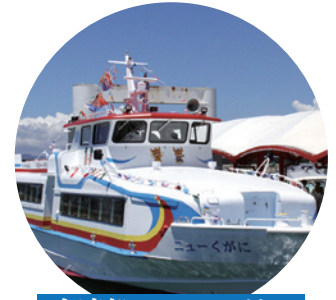
高速船ニューくがに