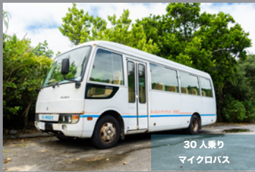
30人乗り マイクロバス